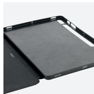
Coque TPU souple