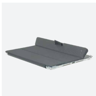
Mise en veille et réveil automatique