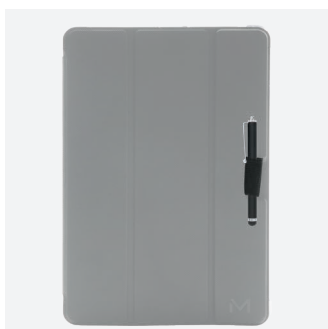
Stylet non inclus