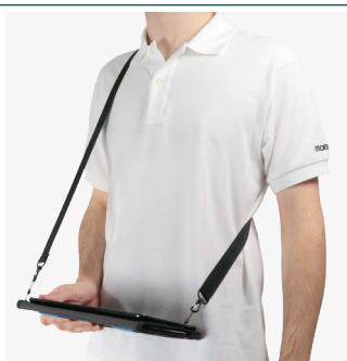
Pour la saisie en position debout