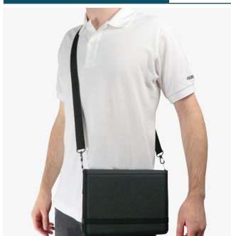
Pour le transport