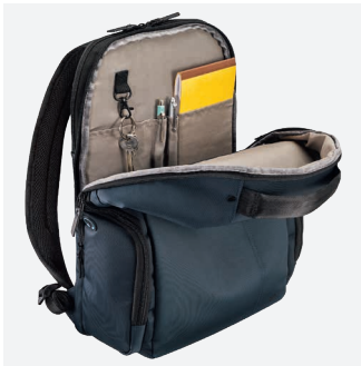
Avec organisateur, poche filet et accroche-clé