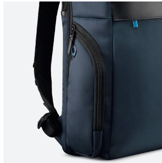
Dont une avec sortie Powerbank