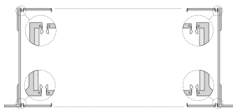
Combinations of horizontal rails and side panels