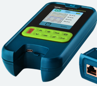
Abnehmbare Remote-Einheit mit RJ45 Port