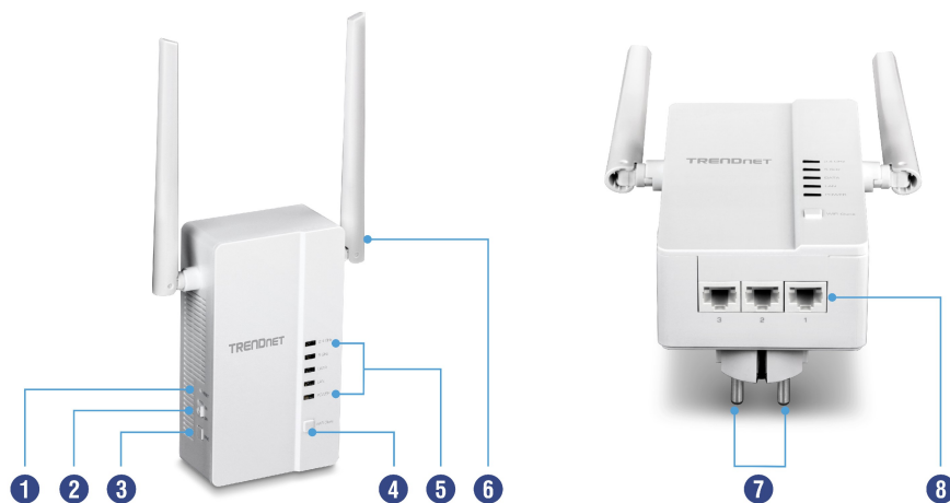
Illustration Eines Network

Mit der WPS-Taste Ihres Routers und der Wi-Fi Clone Taste des TPL-430AP können Sie den Netzwerknamen und das Passwort Ihres bestehenden Netzwerks praktisch für schnelle Netzwerkintegration kopieren.